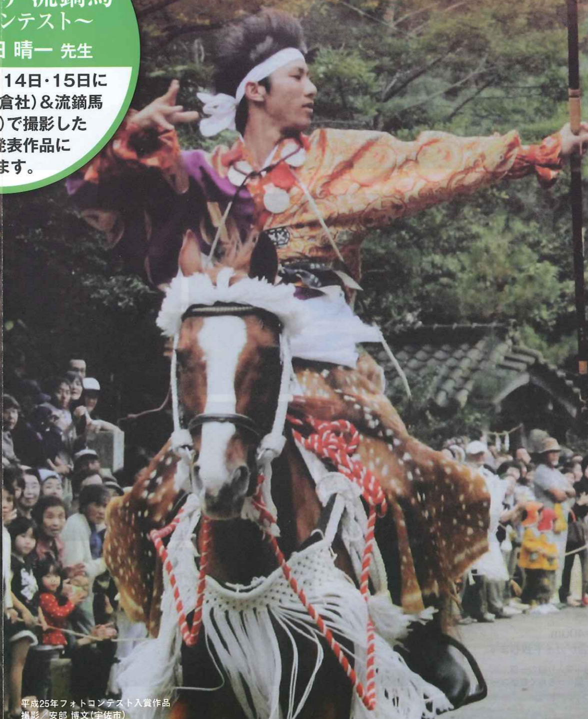
平成25年フォトコンテスト入賞作品 撮影/安部 博文(宇佐市)